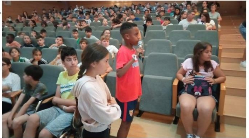
Encuentro de centros del Distrito Este - Alcosa - Torreblanca