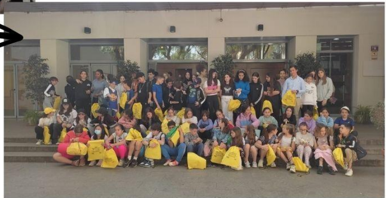
Encuentro de centros del Distrito Casco Antiguo