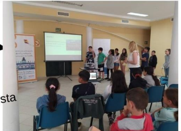
Encuentro de centros del Distrito San Pablo - Santa Justa