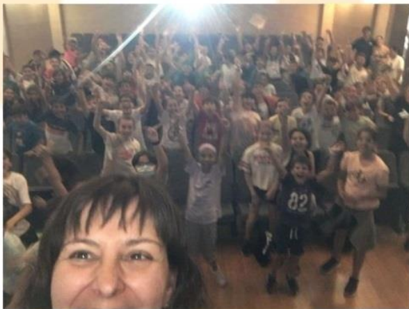
Encuentro de centros del Distrito Bellavista - La Palmera