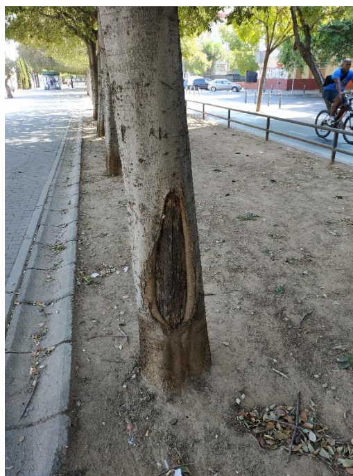
Imágenes del ejemplar con id 150