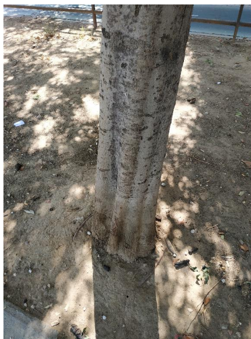
Imágenes del ejemplar con id 157