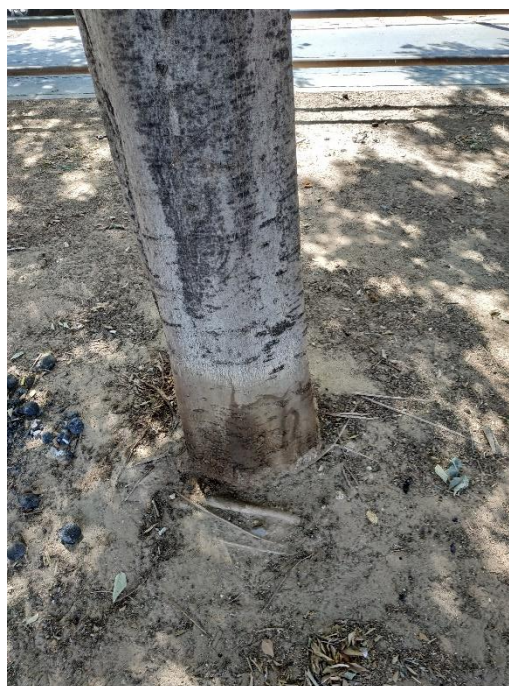
Imágenes del ejemplar con id 196