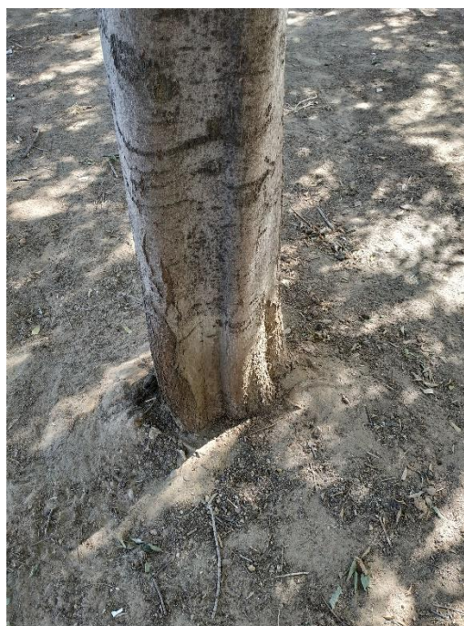
Imágenes del ejemplar con id 200