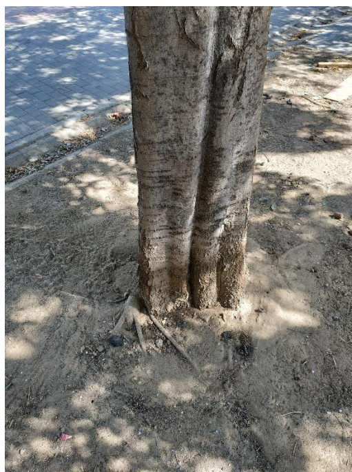
Imágenes del ejemplar con id 207