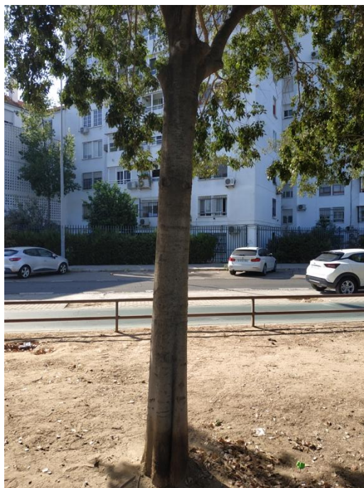
Imágenes del ejemplar con id 255