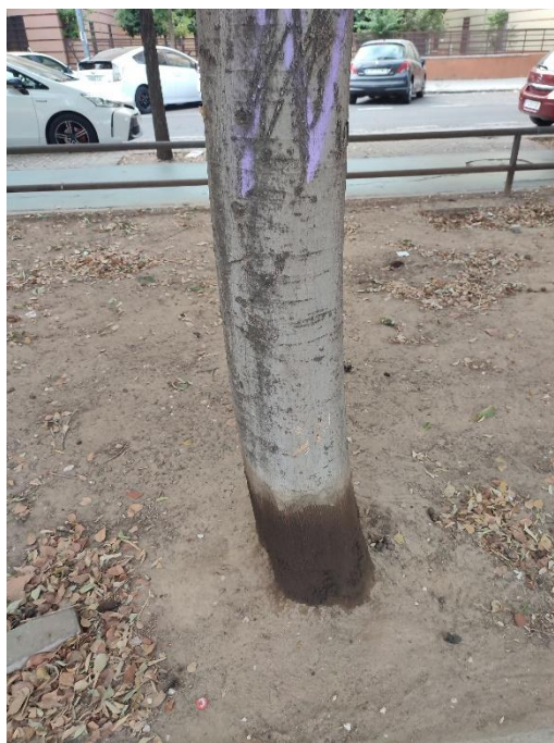
Imágenes del ejemplar con id 75