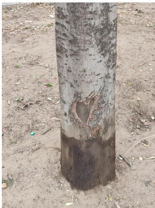
Imágenes del ejemplar con id 123118