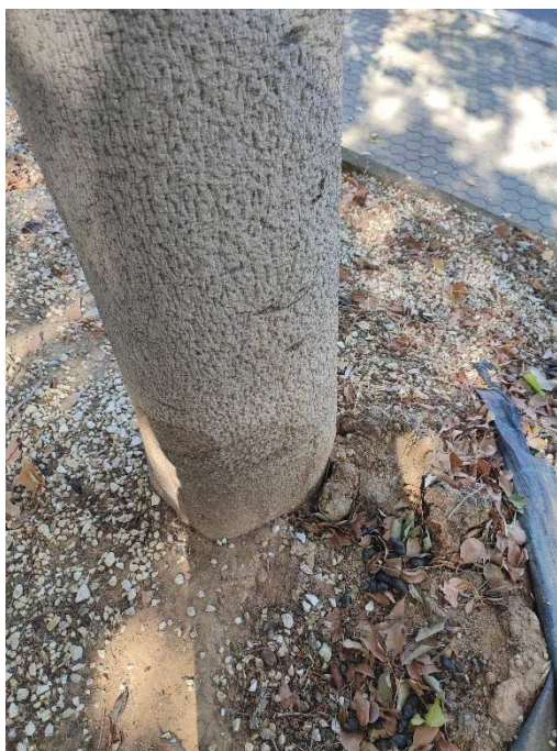
Imágenes del ejemplar con id 256