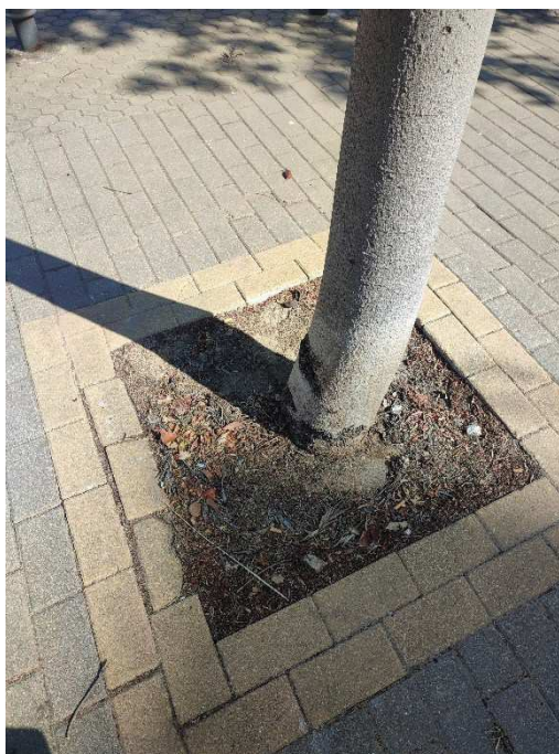
Imágenes del ejemplar con id 238