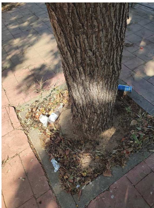
Imágenes del ejemplar con id 237