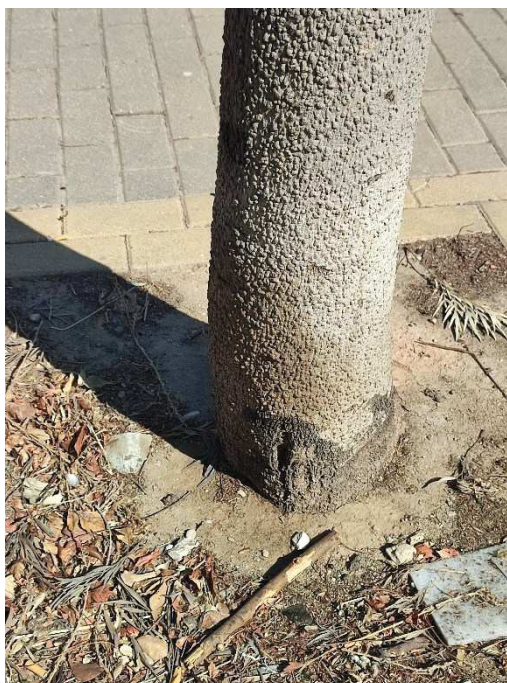
Imágenes del ejemplar con id 235