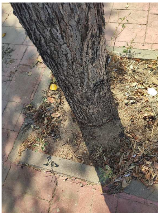
Imágenes del ejemplar con id 233