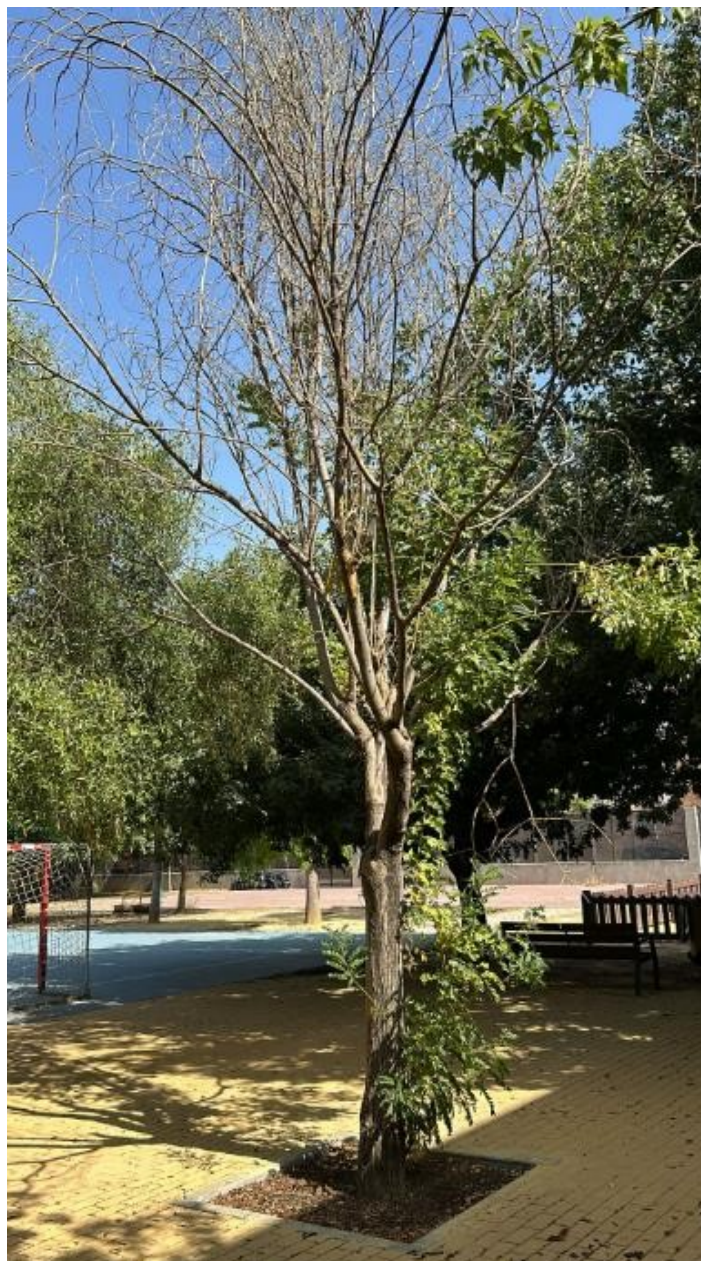
Calle Nicolás Alpérez s/n (Pabellón de la Telefónica de la Exposición de 1929) 41013 Sevilla Teléfono 95 54 73232