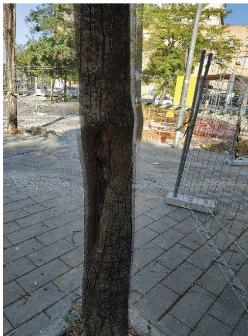
Heridas del ejemplar con id 123409