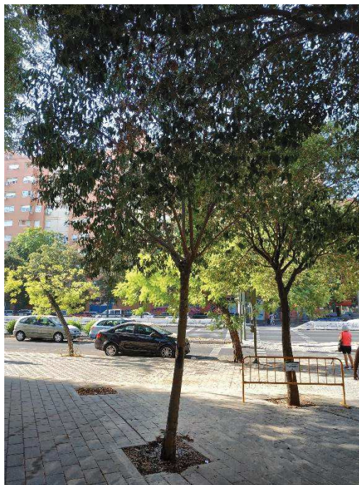
Imágenes del ejemplar con id 123404