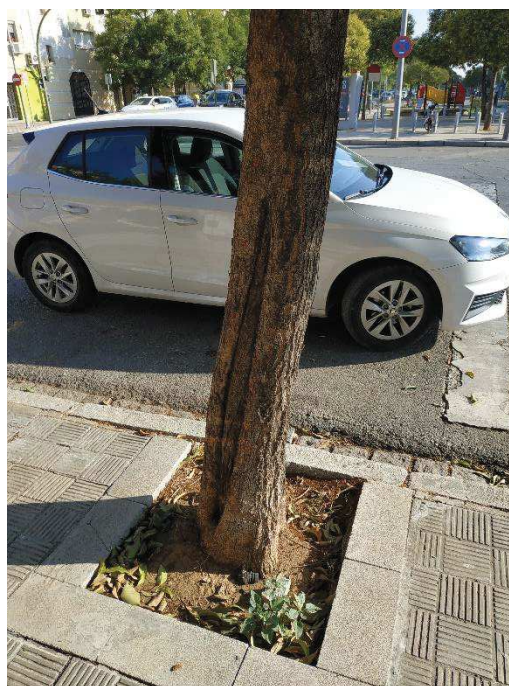
Imágenes del ejemplar con id 43613