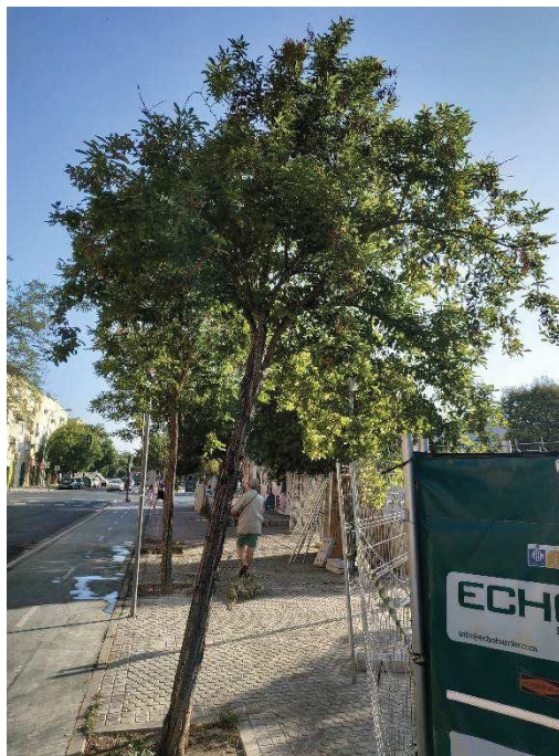
Vista general del ejemplar con id 43603