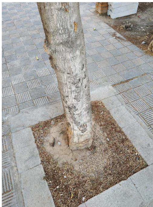
Vista general del ejemplar con id 43600