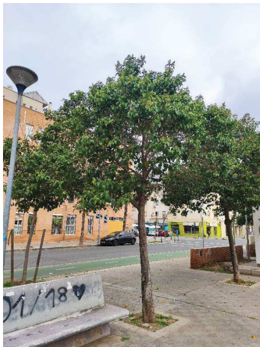
Vista general del ejemplar con id 43599