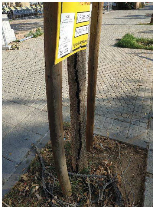
Vista general del ejemplar con id 43581