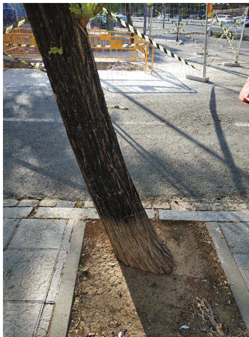
Vista general del ejemplar con id 43579