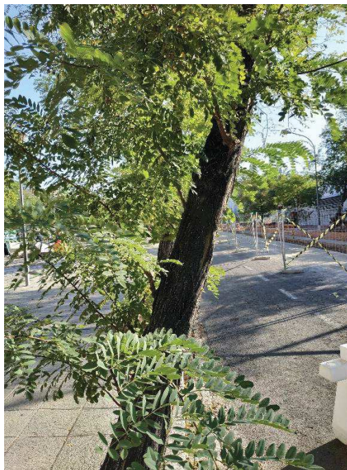
Vista general del ejemplar con id 43578