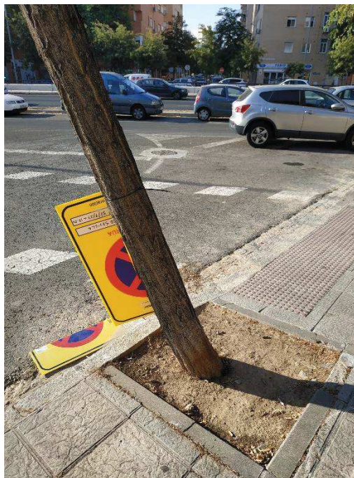
Vista general del ejemplar con id 43577