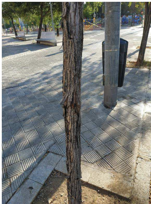
Vista general del ejemplar con id 43574