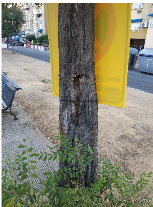
Detalle de cavidad del ejemplar con id 43682