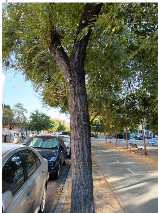
Detalle de lesiones en copa y cruz