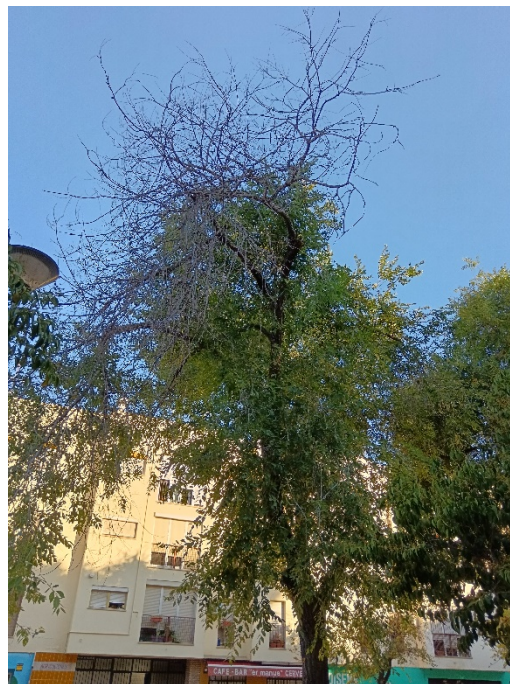
Vista general del ejemplar con id 43818