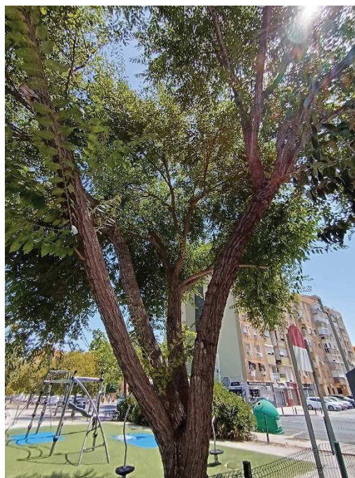
Detalle de cruz y copa