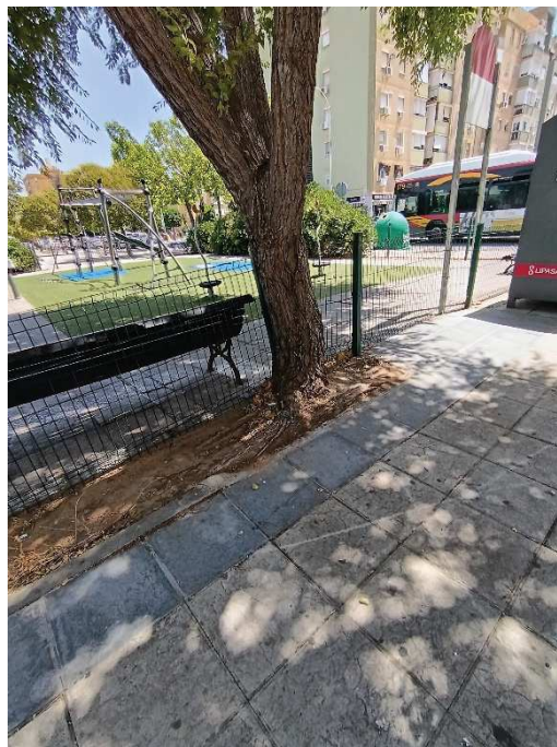
Vista general del ejemplar con id 43854