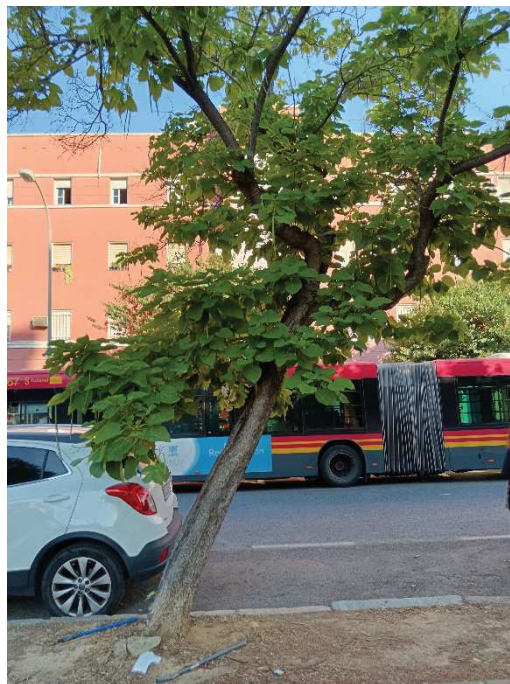
Vista general del ejemplar con id 43930