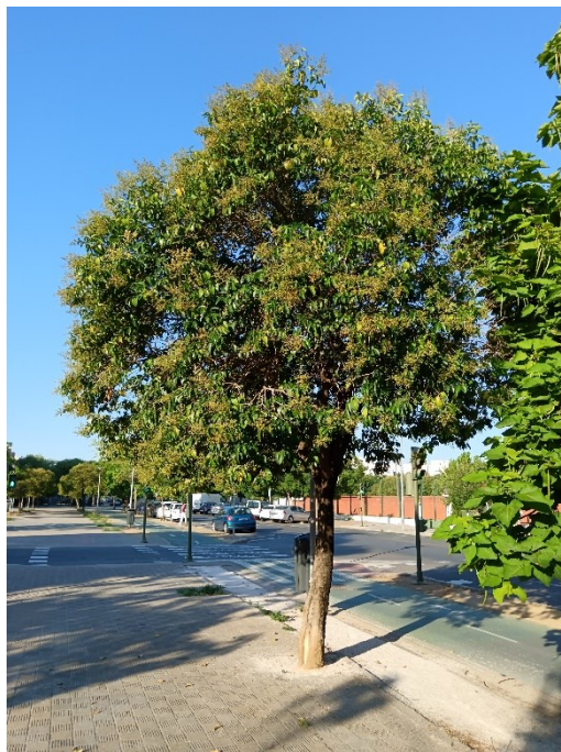
Vista general del ejemplar con id 43911