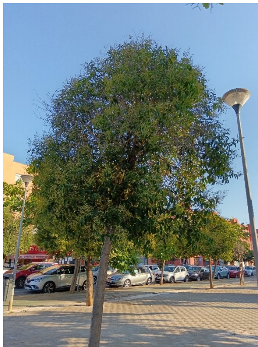
Vista general del ejemplar con id 43909