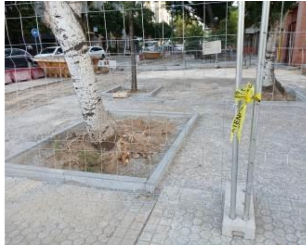
Vista en septiembre 2024 (arriba) y vista en junio 2022 (abajo)