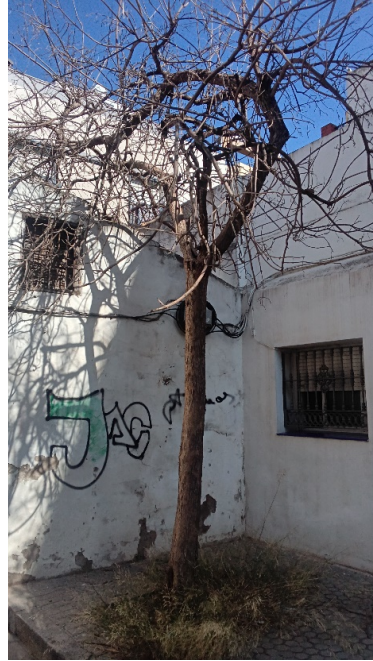
Vista general: árbol seco, copa desestructurada.