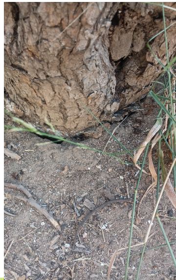
Izquierda: Copa rala, totalmente seca, desestructurada. Derecha: Heridas en la base del tronco por daños mecánicos con pudrición. Grietas en el suelo alrededor del tronco por balanceo.

Ayuntamiento de Sevilla Plaza Nueva, 1 41001 Sevilla +34 955 010 010 www.sevilla.org