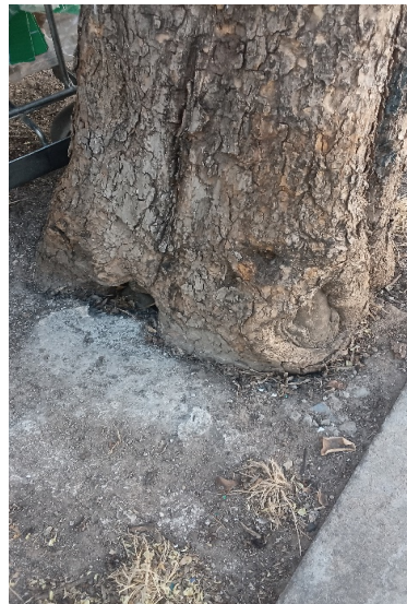
Izquierda: copa más de un 95% totalmente seca y heridas por desgajes. Derecha: heridas/cavidad en la base del tronco por daños mecánicos. Vertidos en el alcorque

Ayuntamiento de Sevilla Plaza Nueva, 1 41001 Sevilla +34 955 010 010 www.sevilla.org