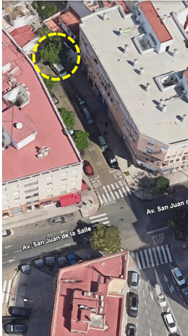
Localización: Catalpa bignonioides con ID 34 en la Avenida San Juan de la Salle del distrito Macarena