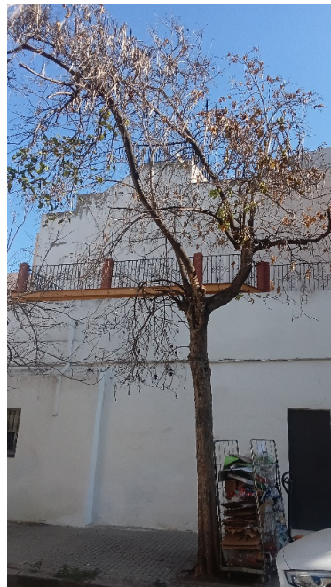
Vista general: árbol seco, terciado.