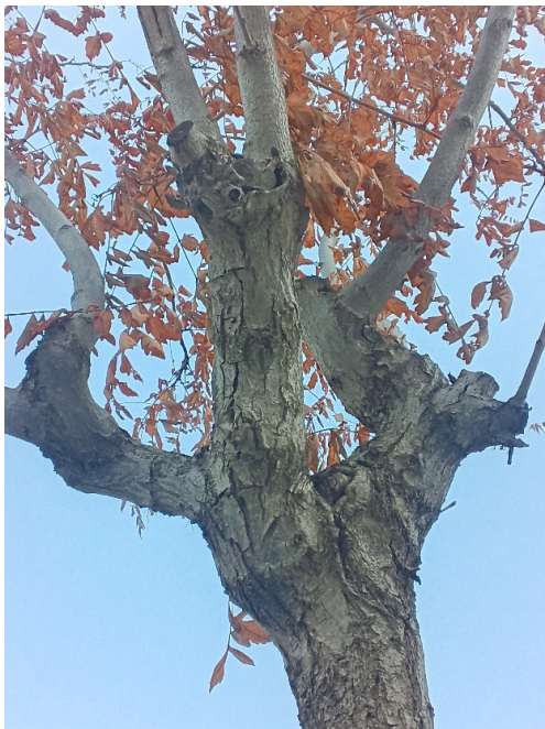
Defoliación y ramas secas superior al 90% de la copa