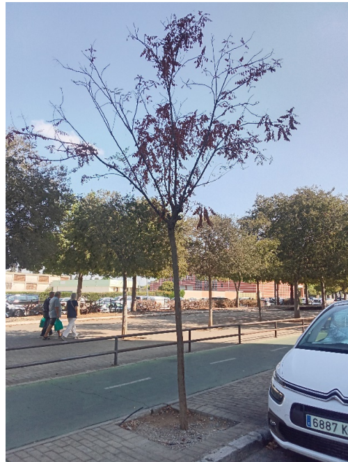
Vista general: árbol seco.