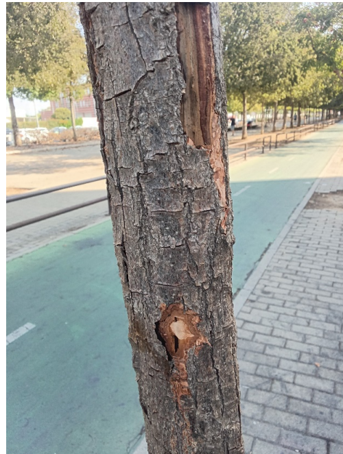
Comprobación árbol seco.

Ayuntamiento de Sevilla Plaza Nueva, 1 41001 Sevilla +34 955 010 010 www.sevilla.org