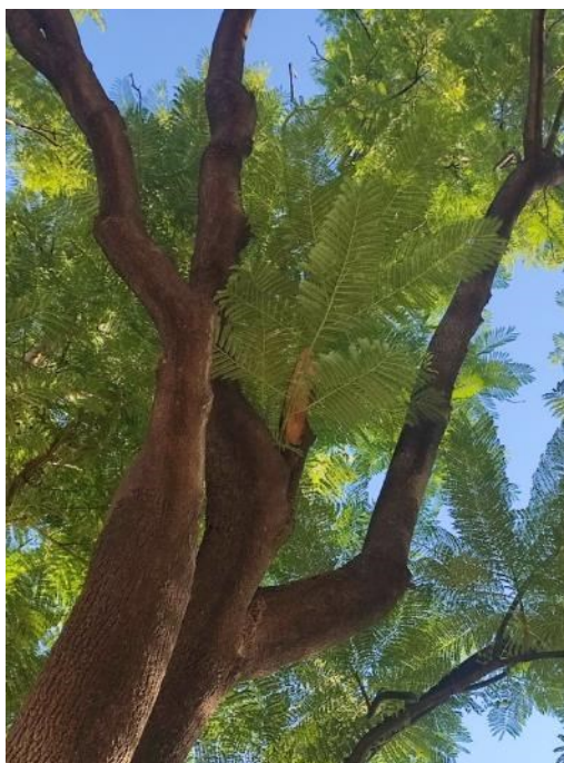
Imágenes del ejemplar con id 151