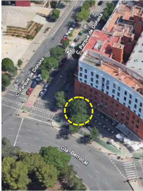
Localización: Robinia pseudoacacia con ID 116891 en la Calle Parque De Grazalema del Distrito Norte.