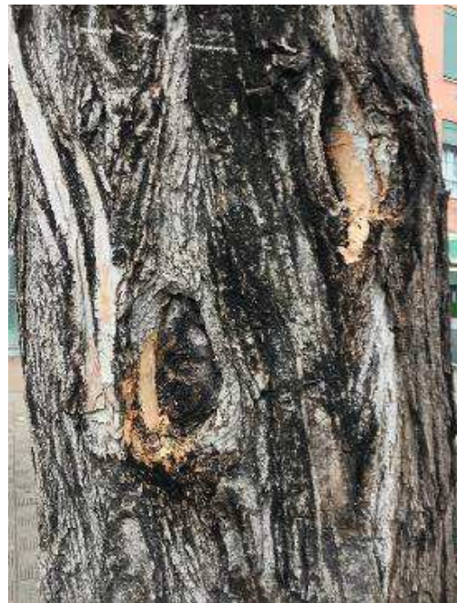
Comprobación árbol seco.

Ayuntamiento de Sevilla Plaza Nueva, 1 41001 Sevilla +34 955 010 010 www.sevilla.org