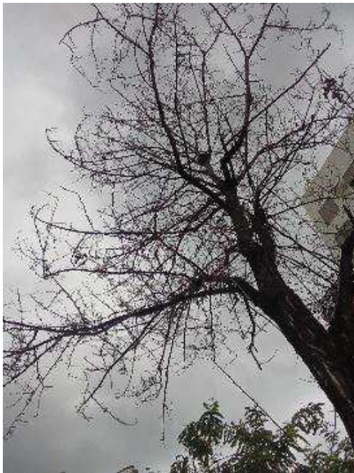
Defoliación y ramas secas superior al 90% de la copa.