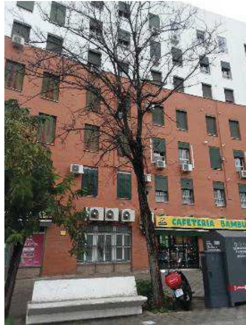
Vista general: árbol seco.