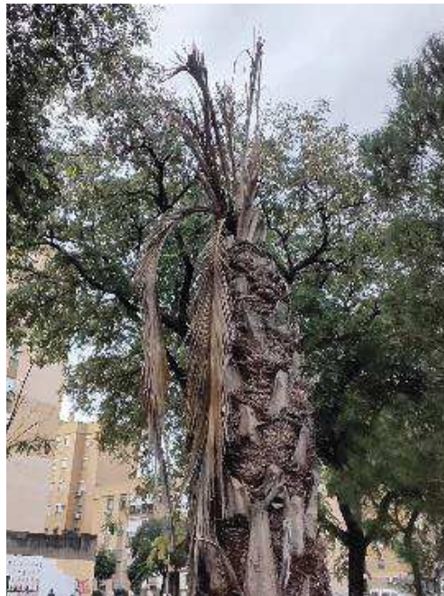
Palmas y meristemo apical seco.

Ayuntamiento de Sevilla Plaza Nueva, 1 41001 Sevilla +34 955 010 010 www.sevilla.org