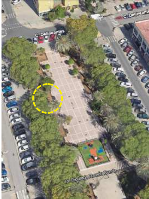
Localización: Phoenix dactylifera con ID 44169 en la Plaza Diputado Ramón Rueda del Distrito Norte.