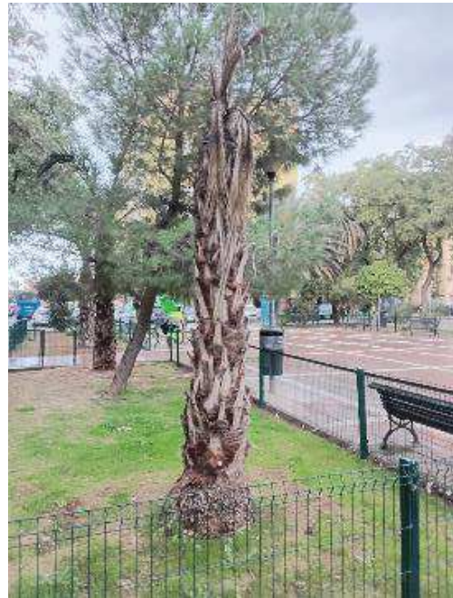
Vista general: palmera seca.