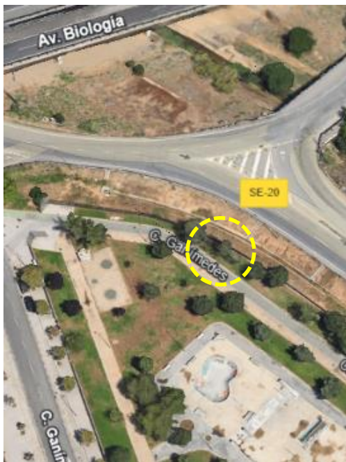
Localización: Populus simonii con ID 125567 en el Parque Ciudad de la Imagen del Distrito Norte.