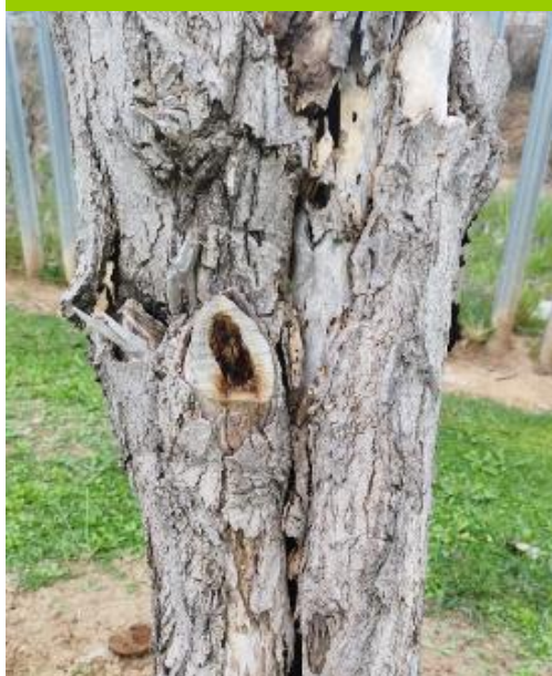
Grave afectación por chancro/heridas (fisuras)/madera de herida en el tronco/primarias producido por la acción conjunta de hongos -entre ellos Cytospora chrysosperma (chancro del álamo)- e insectos xilófagos. Defoliación y ramas secas superior al 90% de la copa, descortezamientos con fendas verticales.