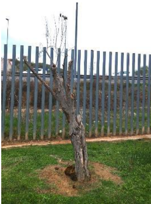
Vista general: árbol seco.