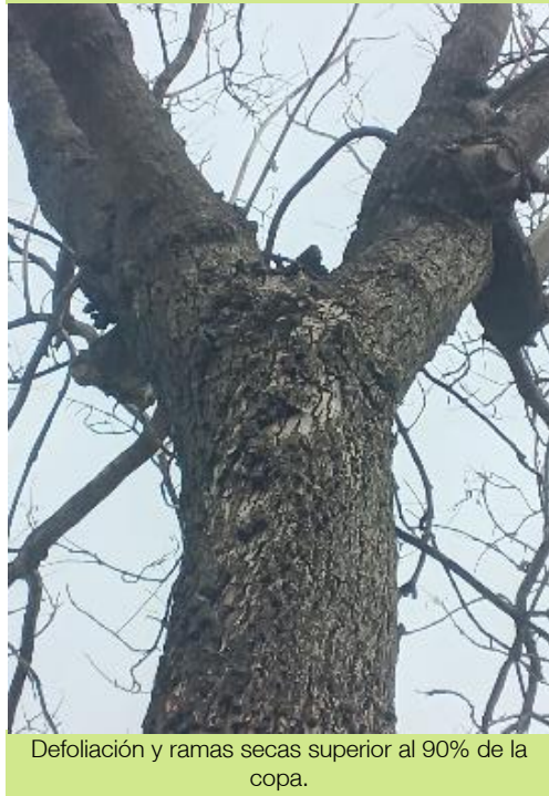
Defoliación y ramas secas superior al 90% de la copa.