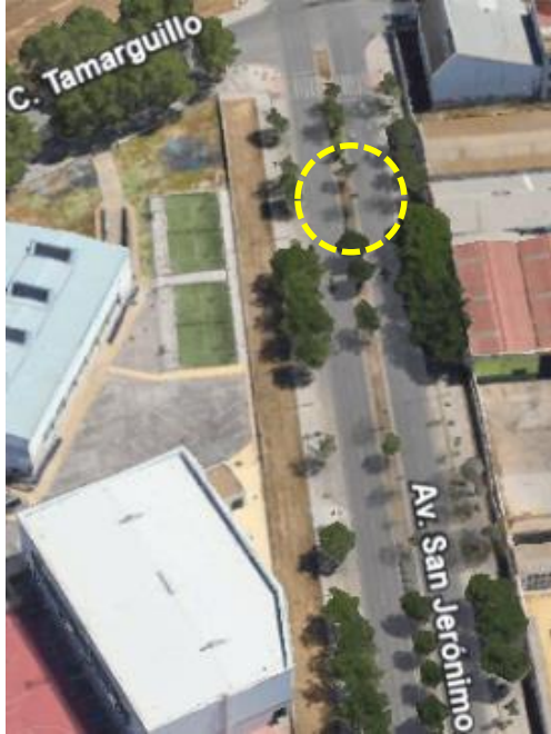
Localización: Jacaranda mimosifolia con ID 3291 en la Avenida San Jerónimo del Distrito Norte.