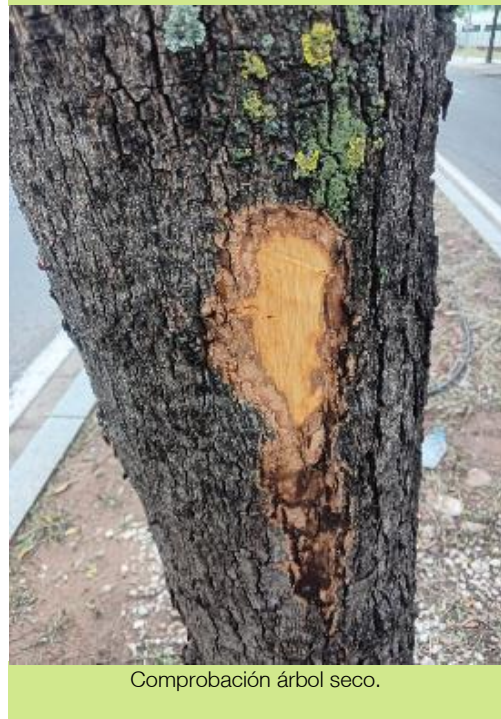
Comprobación árbol seco.

Ayuntamiento de Sevilla Plaza Nueva, 1 41001 Sevilla +34 955 010 010 www.sevilla.org