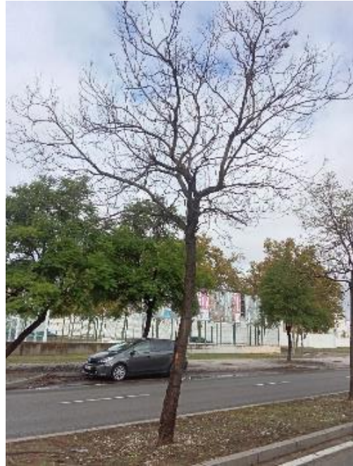
Vista general: árbol seco.