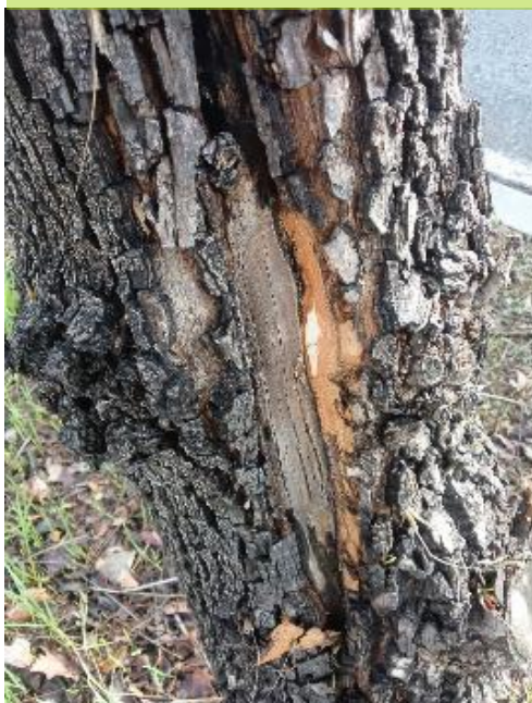
Comprobación árbol seco.

Ayuntamiento de Sevilla Plaza Nueva, 1 41001 Sevilla +34 955 010 010 www.sevilla.org