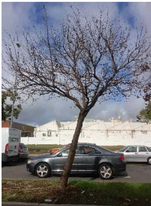
Vista general: árbol seco.