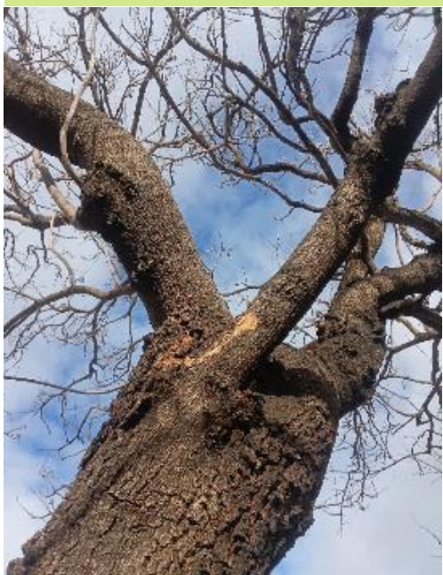
Defoliación y ramas secas superior al 90% de la copa.