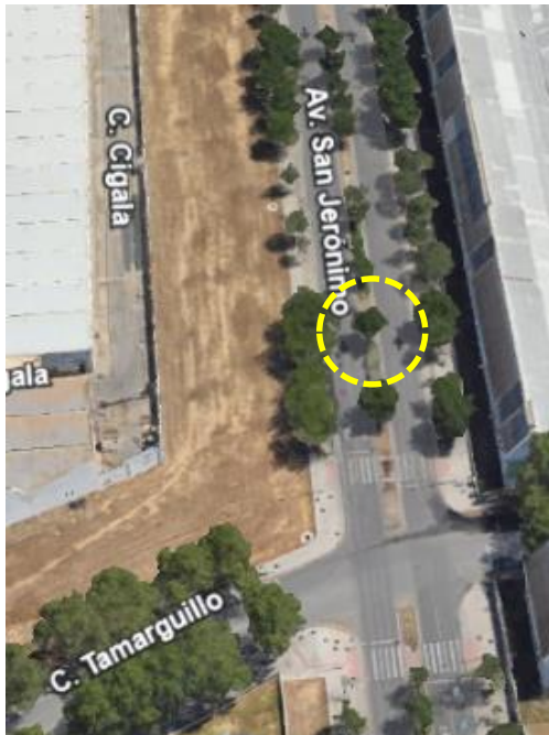
Localización: Jacaranda mimosifolia con ID 3155 en la Avenida San Jerónimo del Distrito Norte.