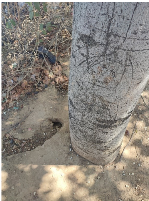
Imágenes del ejemplar con id 123200