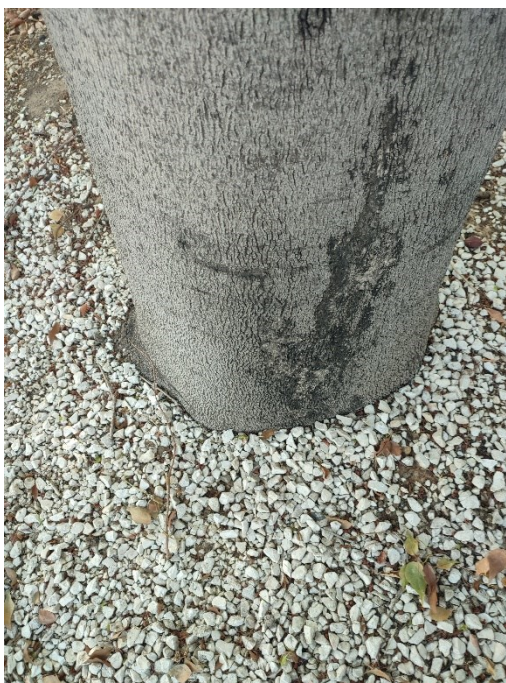
Imágenes del ejemplar con id 314