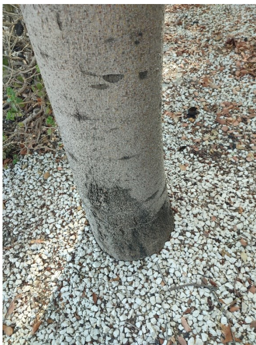
Imágenes del ejemplar con id 312