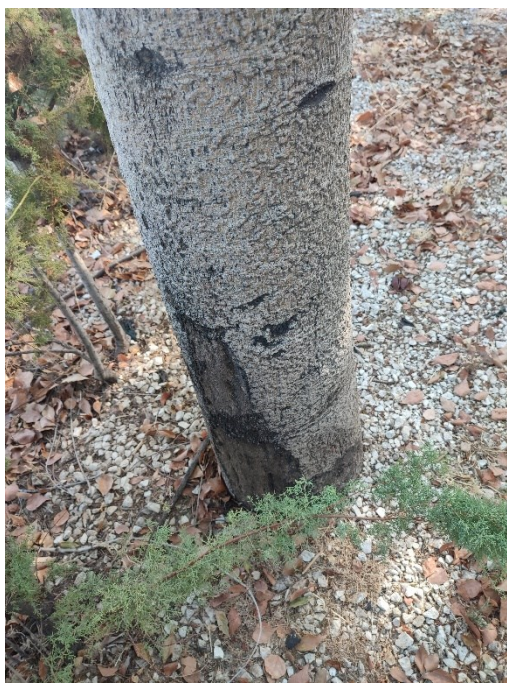
Imágenes del ejemplar con id 307