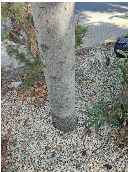
Imágenes del ejemplar con id 294