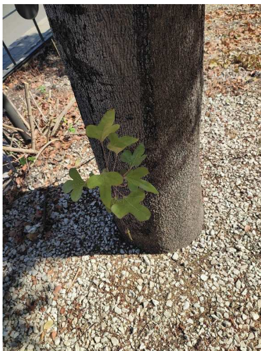
Imágenes del ejemplar con id 172