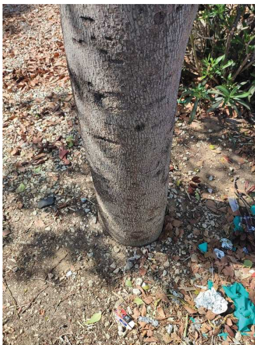
Imágenes del ejemplar con id 135