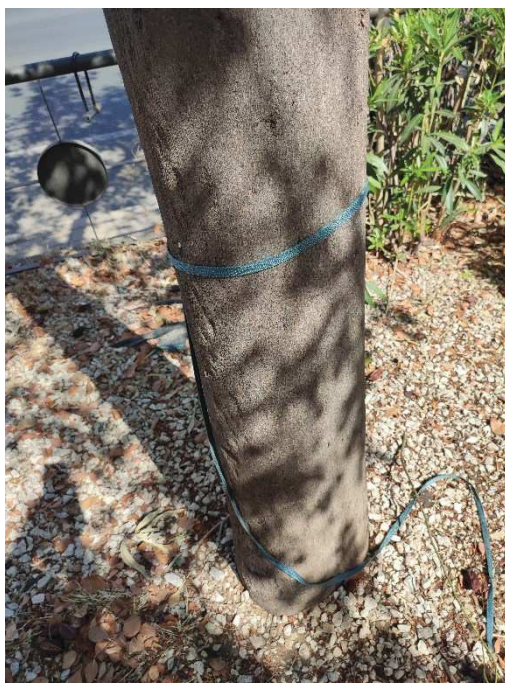
Imágenes del ejemplar con id 132